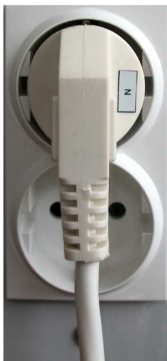
Рис.2. Подключение к сети.

Внимание! При включении приборов с большими пусковыми токами при работе от АКБ, на короткое время может сработать защита от перегрузки. Это сопровождается звуковым сигналом, показаниями индикатора нагрузки и не является неисправностью.