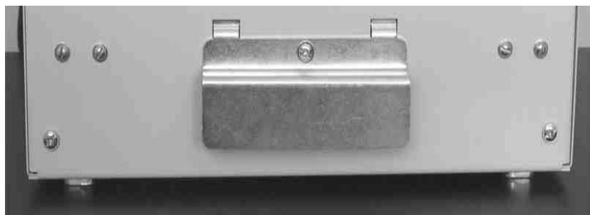
Рис. 3 Упорная планка