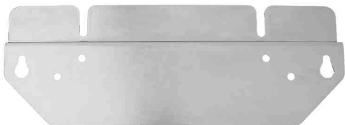
Рис. 2 Крепежная планка

Для размещения стабилизатора на стене сначала монтируется крепежная планка (Рис.2), потом на нее подвешивается аппарат и производится подключение токоведущих проводников. Предварительно на стабилизатор необходимо установить упорную планку (Рис.3).