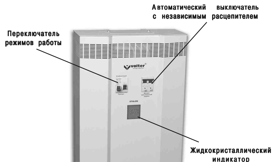
Рис. 1. Стабилизатор напряжения

В верхней части расположен клеммник, для подключения стабилизатора, закрытый крышкой. Там же расположен заземляющий контакт.